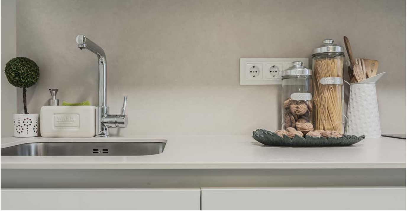
Frente en continuidad con la encimera