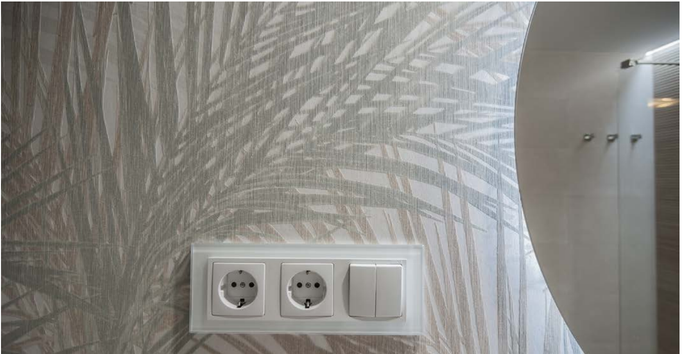
Papel pintado con acabado textil